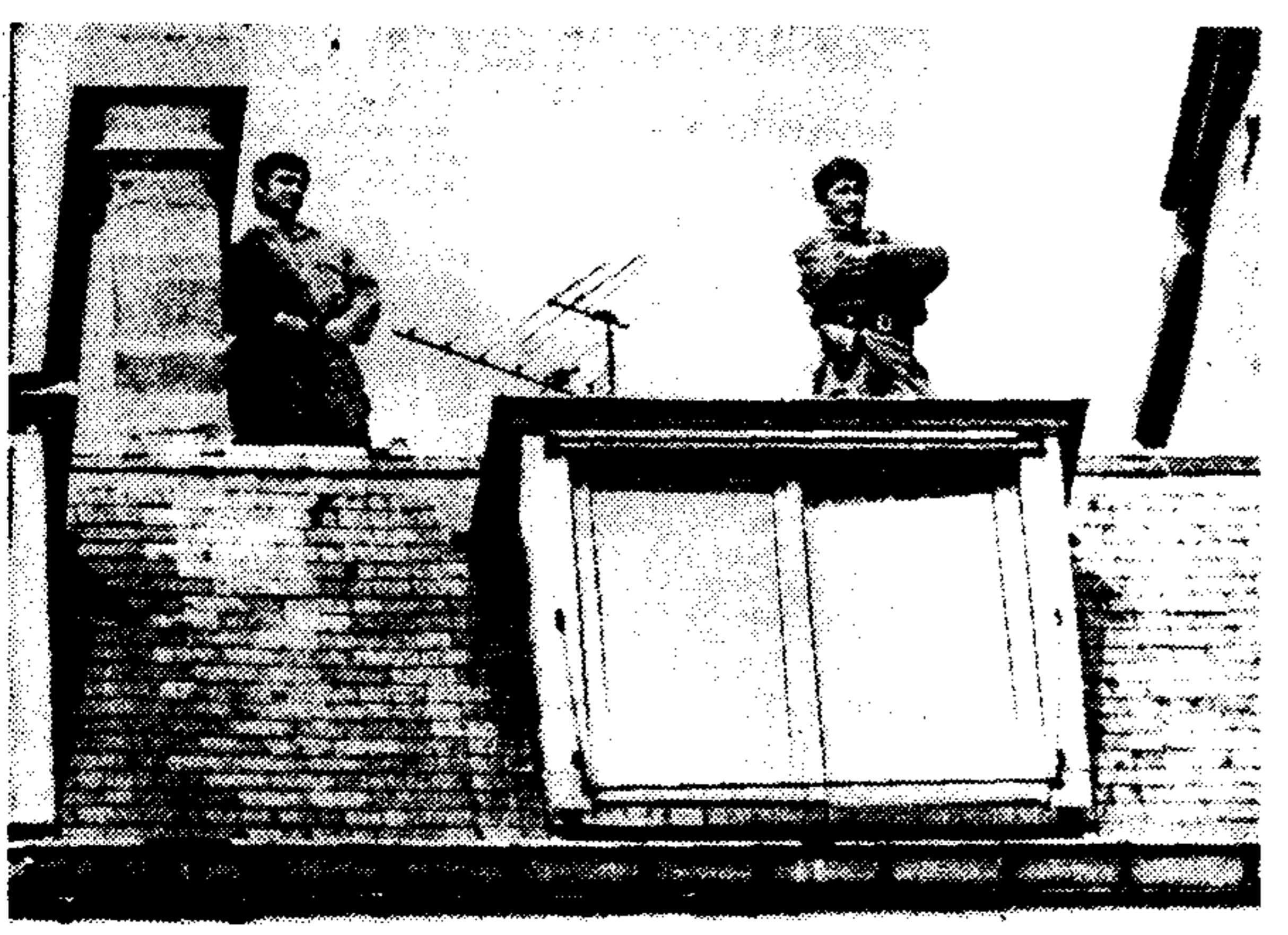
Δρακόντιες μέτρα «αντιτρομοκρατίας» στη Γαλλία. Ένοπλοι φρουροί σε ταράτσες γύρω από όλα τα κτίρια, όπου είναι εγκατεστημένες καίριες υπηρεσίες, όπως τα ταχυδρομεία, οι πρεσβείες, οι ξένες εταιρίες κλπ.

ΛΟΝΔΙΝΟ, 22. Γαλλικό Πρακτορείο, Ρώμη, Ήν. Τύπος, Άσσοσιέιτεν Πρές